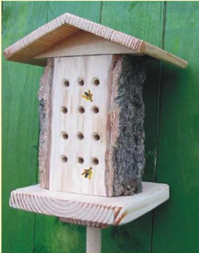
Single Bee "Drive In" Art. No.: 541936