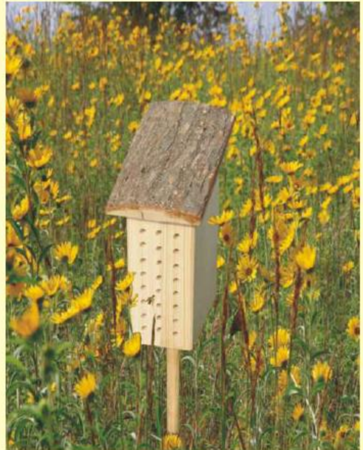
Enlige Bier Single Bee Lodgings Art. No.: 541935