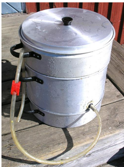
Saftmaja (kan ibland köpas på loppis (ca 50 kr)... om man har tur...)

Fort gick det! När jag tittade till ramarna efter två timmar var de redan tomma! Varmt i kvällssolen. Ramarna behöver fortfarande tvättas, och vaxet behöver ytterligare rengöring. Jag ska offra en saftmaja till vaxrening har jag tänkt, och ramarna borde bli rena om man doppar dem i kokande vatten en stund.